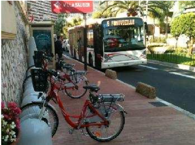
Implantation pour du libre-service Principauté de Monaco