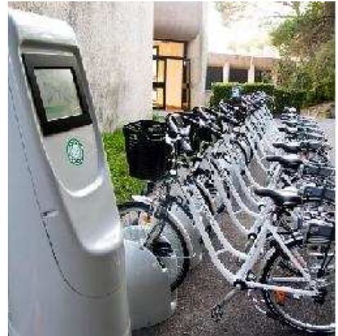
Implantation Skema Business School, Sophia-Antipolis

Créée en 2006, Clean Energy Planet est une Jeune Entreprise Innovante engagée dans le développement durable. Ses enjeux sont doubles : il s'agit de favoriser le déplacement durable grâce à des produits réellement innovants, et d'offrir aux entreprises le conseil nécessaire à la réussite de leurs démarches environnementales.